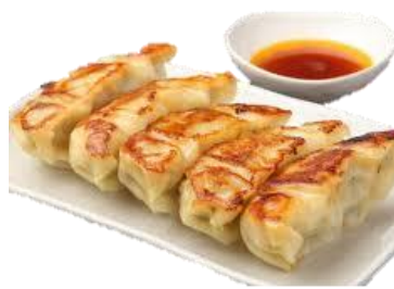
ぎょうぎ 焼き餃子(5個) 345 円(税込 380 円)