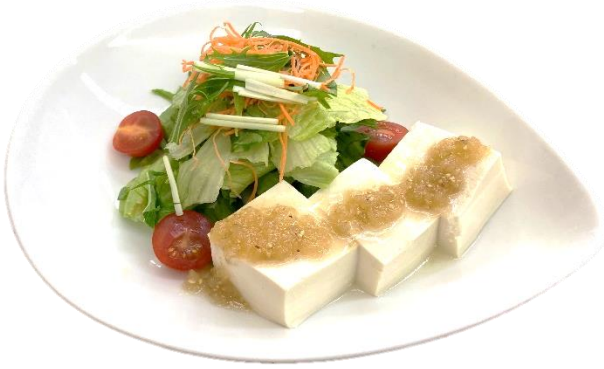
豆腐の胡麻だれサラダ 564 円(税込 620 円)