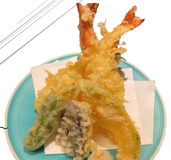
天婦羅盛り合わせ ～海老・茄子・舞茸・獅子唐・南瓜～ 591 円(税込 650 円)