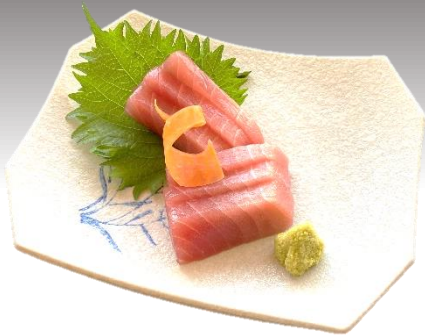
ばちまぐろ 鉢 鮭刺し 864 円(税込 950 円)