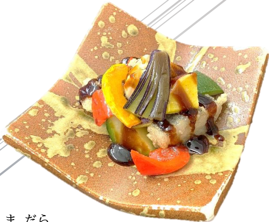
まだら 真鱈と彩り野菜の黒酢あんかけ 773 円(税込 850 円)