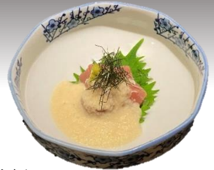
まぐろ 鮭の山かけ 745 円(税込 820 円)