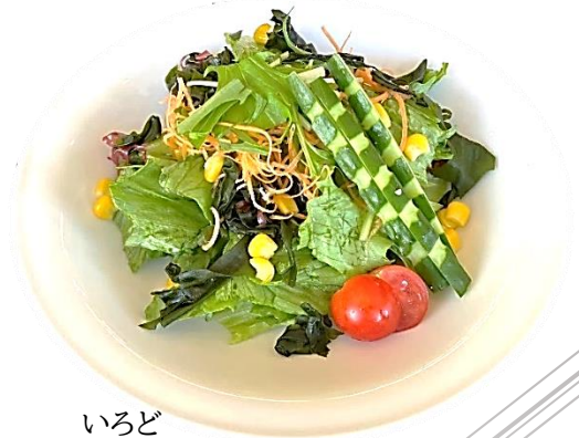
いろど 彩りサラダ 436 円(税込 480 円)