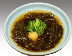
もずく酢 318円 (税込350円)