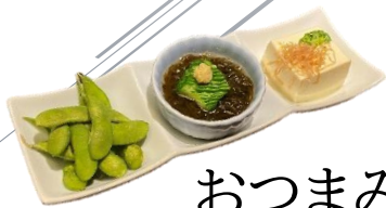
おつまみ三点盛り 364円 (税込400円)