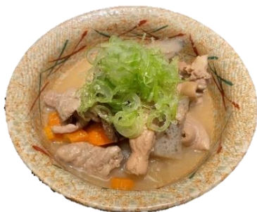
もつ煮 473円 (税込520円)