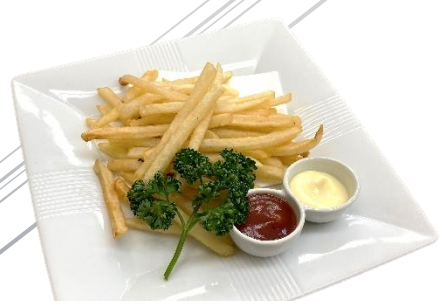
フライドポテト 345円 (税込380円)