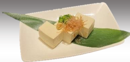
きぬ 国産大豆の絹豆腐 318円 (税込350円)