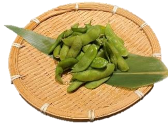
枝豆 318円 (税込350円)