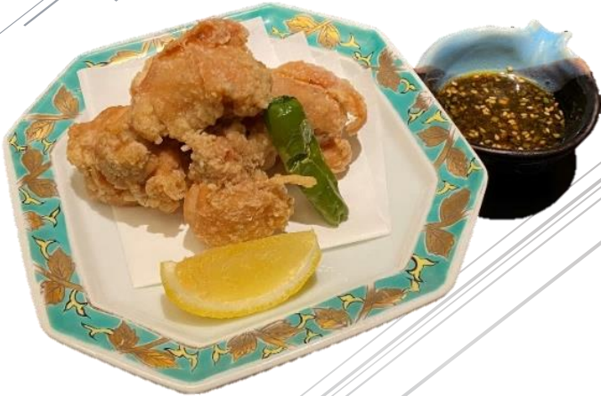
鶏の唐揚げ 500円 (税込550円) ～香味醤油添え～